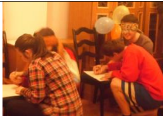
А знаете ли вы, что когда человек смеется, воздух из его легких вылетает примерно со скоростью 100 км/час. При этом работают 17 мускулов лица. Информация Бранчук Л.Д.