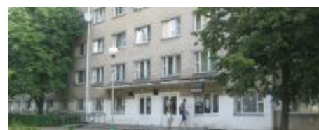
Общежитие № 1