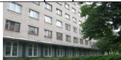
Общежитие № 2

За время моего проживания в общежитии № 2 у меня были только положительные эмоции.