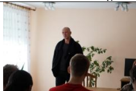
Встреча проходила в комнате отдыха общ. № 1