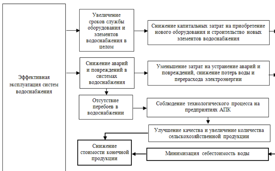
Рис. 2. Анализ причинно-следственных связей между эффективной эксплуатацией сельскохозяйственных систем водоснабжения и затратами на водоснабжение [разработка автора]

Эффективность эксплуатации сельскохозяйственных систем водоснабжения оказывает влияние на величину себестоимости и качество воды, а также стоимость сельскохозяйственной продукции. Анализ причинно-следственных связей между эффективной эксплуатацией сельскохозяйственных систем водоснабжения и затратами на водоснабжение представлен на рис. 2.