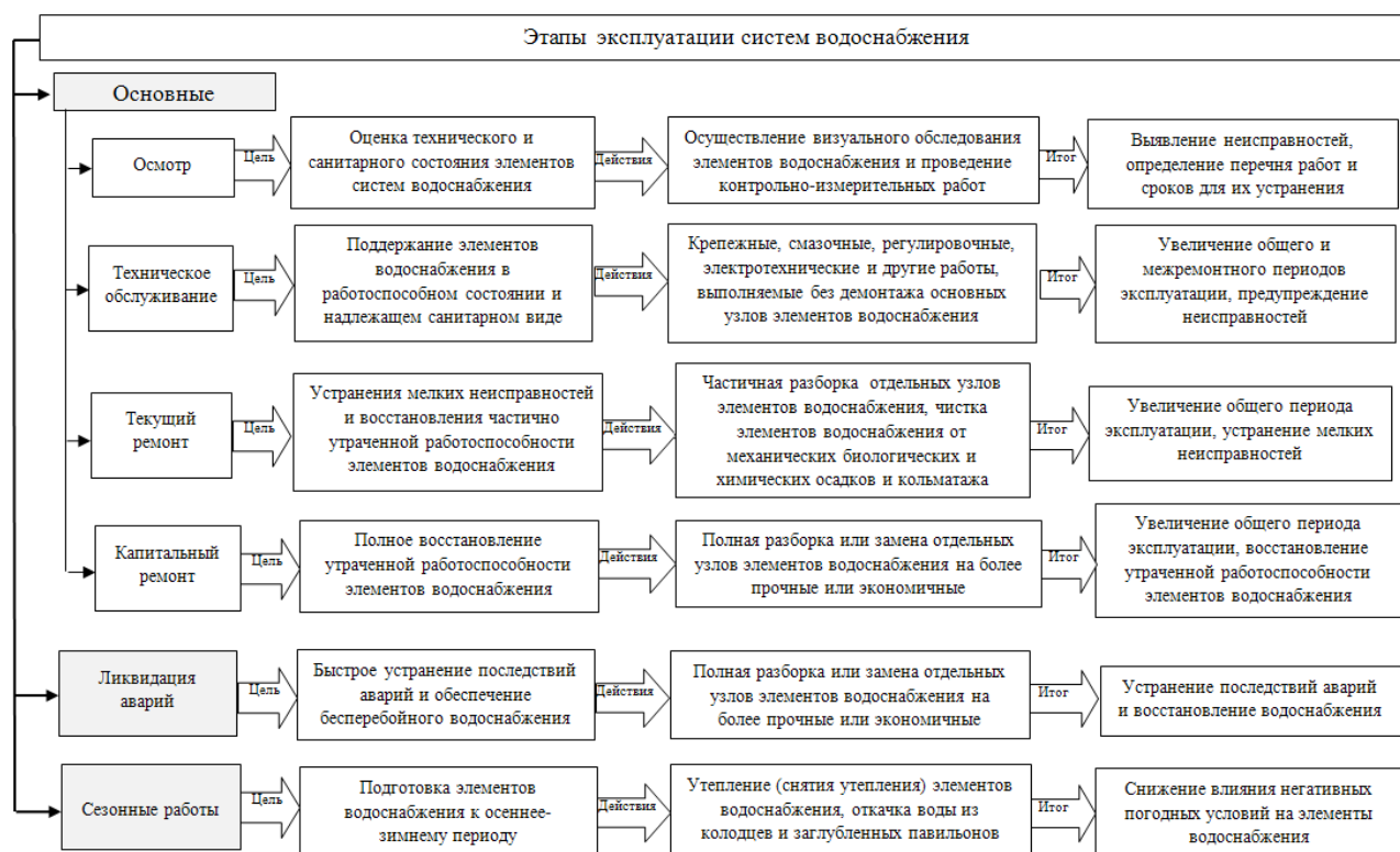
Рис. 4. Систематизация этапов эксплуатации для обеспечения эффективной эксплуатации систем водоснабжения

В ходе реализации блока менеджмента сначала определяется типовой перечень работ по эксплуатации для каждого элемента водоснабжения, на основании которого разрабатывается и утверждается план проведения работ по эксплуатации, мероприятий по повышению надежности, экономичности и качества водоснабжения, а также определяются исполнители работ. Затем происходит контроль за полнотой и качеством выполнения действующего плана для его последующей корректировки в целях повышения эффективности эксплуатации систем водоснабжения.