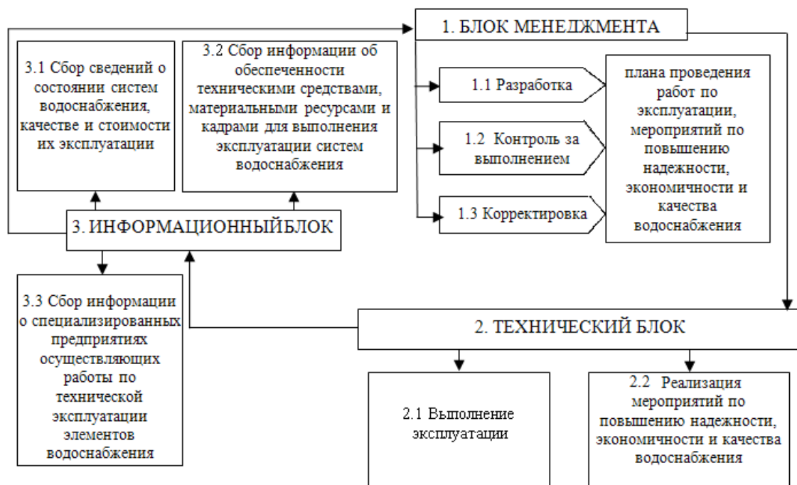
Рис. 3. Взаимосвязь характерных блоков, обеспечивающих эффективную эксплуатацию систем водоснабжения [разработка автора]

О понятии «эксплуатация сельскохозяйственных систем водоснабжения». Термин «эксплуатация» произошел от французского слова «exploitation», что в переводе означает использование, извлечение выгоды.