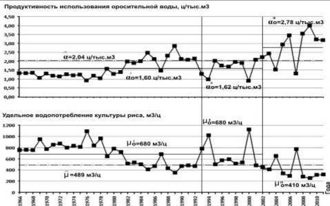
Рис. 2. Динамика изменения удельных показателей эффективности функционирования Придунайских РОС за период 1966-2011гг. (на примере Килийской РОС)

этим, на большей части территории Придунайских РОС сложилось неблагоприятное эколого-мелиоративное состояние, усиленное наличием в сбросных и дренажных водах пестицидов и их составляющих в количествах, значительно превышающих предельно допустимые концентрации.